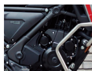
Defensa sobre marco Reforzado