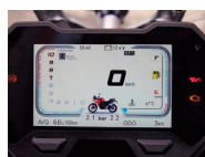
Pantalla TFT Color