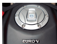
Homologación Euro V