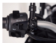
Sistema ABS desconectable