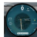
MINI Interaction Unit 9,4"