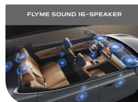
FLYME SOUND 16-SPEAKER