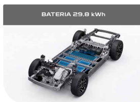
BATERÍA 29,8 kWh