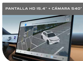
PANTALLA HD 15,4" + CÁMARA 540°