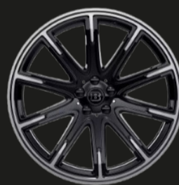
Monoblock Z de 21"

Por favor, consulta la información oficial de lanzamiento para más detalles.