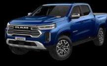
AZUL TEMPEST Exclusivo para Laramie