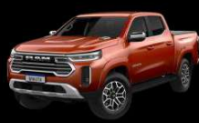
CAFÉ TERRA SUNRISE Exclusivo para Laramie