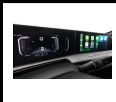
CENTRAL MULTIMEDIA 12,3". ANDROID AUTO & APPLE CAR. MÁS DE 19" EN PANTALLAS