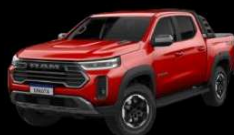
ROJO FURY Exclusivo para Warlock