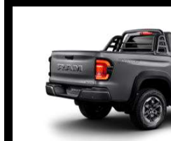
RAMBAR Y CAPOTA MARÍTIMA