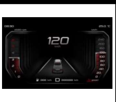
CONTROL CRUCERO ADAPTATIVO